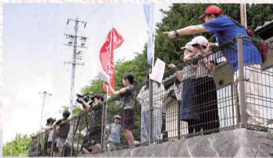
※飯田コアカレッジの学生にボランティアスタッフとして協力いただいています。

大会映像はYouTube ツアー・オブ・ジャパン公式チャンネル 「BPAJ ch」でライブストリーミング配信