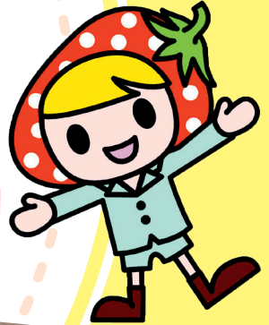
喬木村キャラクター ゴーくん