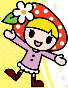
喬木村キャラクター ベリーちゃん