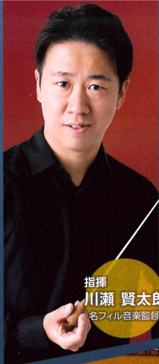
指揮 川瀬 賢太郎 名フィル音楽監督