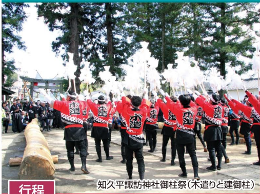
知久平諏訪神社御柱祭(木遣りと建御柱)

りんごの里(8:20)→宮崎氏館跡(座光寺宮崎)→駒場区自治会館(宮崎氏に関する講話)→浄久寺(宮崎氏墓所と紀州徳川家拝領の長柄三種)→きたせんと(昼食)→安布知神社(宮崎氏奇進の本殿※県宝)→宗圓寺(向閩宮崎氏菩提寺)→向閩宮崎氏館跡→中間宮崎氏館跡・中間の大杉→りんごの里(17:00)