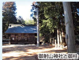
御射山神社と御柱