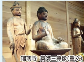
瑠璃寺 薬師三尊像(重文)