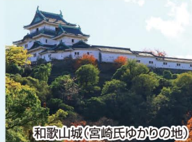
和歌山城(宮崎氏ゆかりの地)