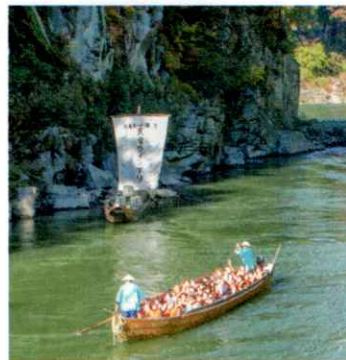
当日のみ帆掛け舟が復活

注) 参加者は体調・ケガ等に気を付けて、自己責任でご参加ください。 駐車場には限りがあります。出来るだけ公共交通機関をご利用ください。