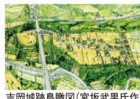
吉岡城跡鳥瞰図(宮坂武男氏作)

吉岡城は下條氏の居城で、2つの渓谷に挟まれた要害の地に築かれました。戦国時代、有力国衆の居城の城下町の様子を現在まで色濃く残しており、敵の侵入を阻む枡形や高札場跡などを見ることができます。※地元専門家によるガイド付き