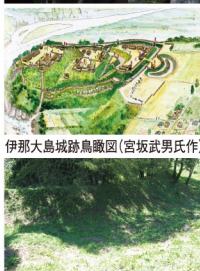
伊那大島城跡鳥瞰図(宮坂武男氏作)

武田信玄による三河・遠江侵攻の前線基地、また本国甲斐の外郭防衛拠点として、いわゆる「武田流築城術」の粋を集めて築かれました。「丸馬出」「三日月堀」など武田流築城術の遺構が大変良く保存されています。専門ガイドが城郭の縄張りについて詳しく説明します。