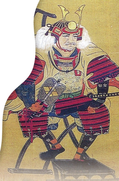
武田信玄肖像画 (根羽村横旗)