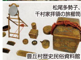
豊丘村歴史民俗資料館