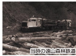
当時の遠山森林鉄道