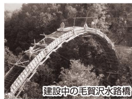
建設中の毛賀沢水路橋