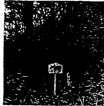
古木の下の子三十三番観音

ひいる場(火ふり場) ここの地名の由来には、「山ひる」が 多くいるところとか、道中の人が、お ひる食べたとか、合図の火を焚いて知 らせた場所とか、諸説がある。