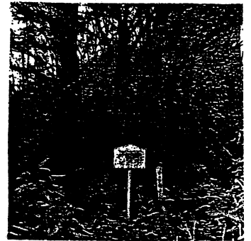
古木の下の子三十三番観音

小川路峠頂上 頂上には古木の イチイとウラジ ロモミがそびえ、 その下に33番 観音がたつ、眺望 は最高である。