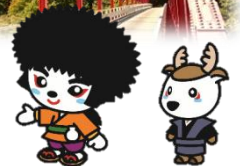
大鹿景清・大鹿鹿丸