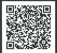
飯田市地域おこし協力隊 facebookページ